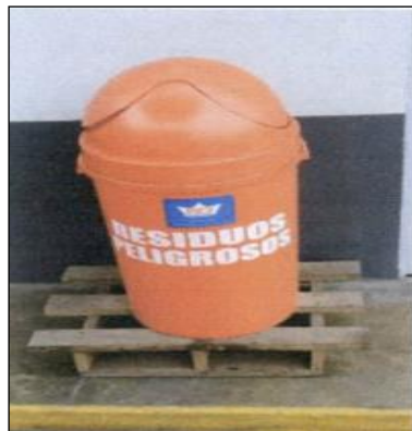
Descargo del administrado, ingresado mediante registro 62833, de fecha 28 de junio de 2019. Folio 53 del Expediente.