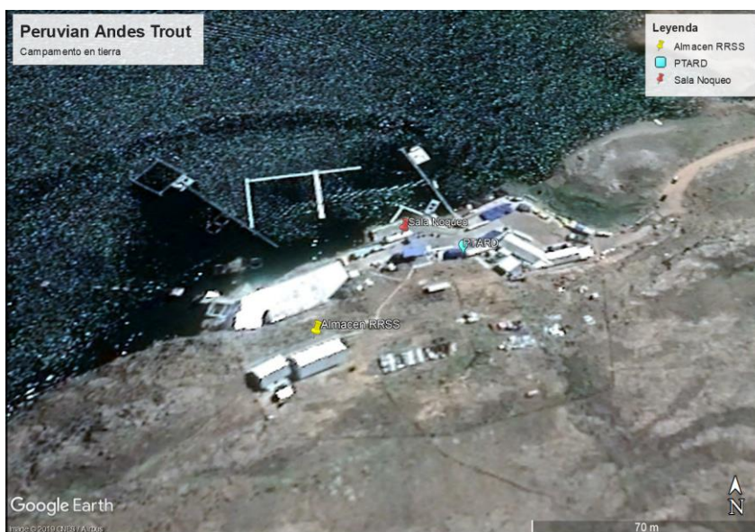
Elaboración: Dirección de Fiscalización y Aplicación de Incentivos del Organismo de Evaluación y Fiscalización Ambiental

104. Se evidencia que las mismas se encuentran dentro del campamento en tierra del CPA del administrado, de acuerdo al siguiente detalle: