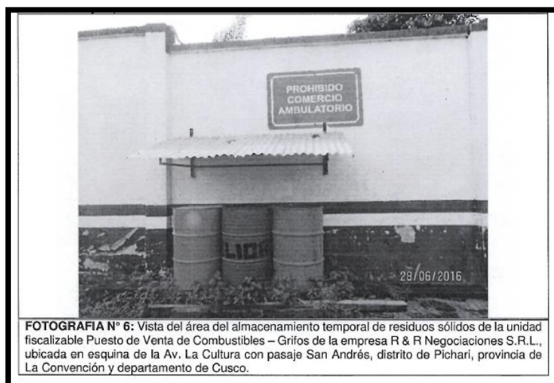
FOTOGRAFIA N° 6: Vista del área del almacenamiento temporal de residuos sólidos de la unidad fiscalizable Puesto de Venta de Combustibles – Grifos de la empresa R & R Negociaciones S.R.L., ubicada en esquina de la Av. La Cultura con pasaje San Andrés, distrito de Pichari, provincia de La Convención y departamento de Cusco.