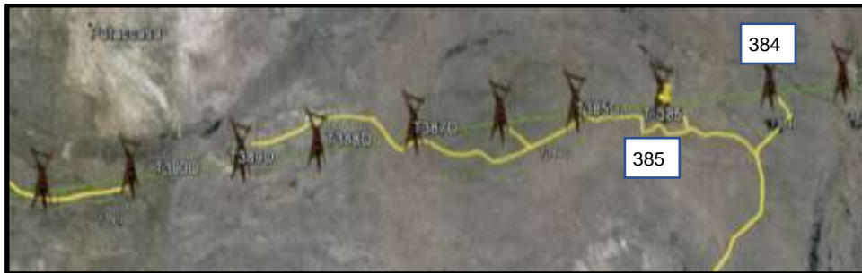
Imagen 1: vía de acceso T-384 y T-385