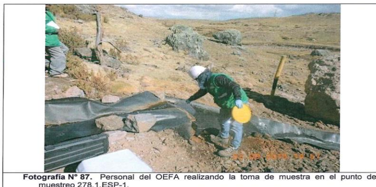
Fotografía N° 87. Personal del OEFA realizando la toma de muestra en el punto de muestreo 278,1,ESP-1.