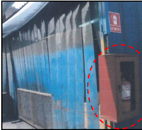
Fotografía N° 01: El Almacén se encuentra cercado y cuenta con extintor.