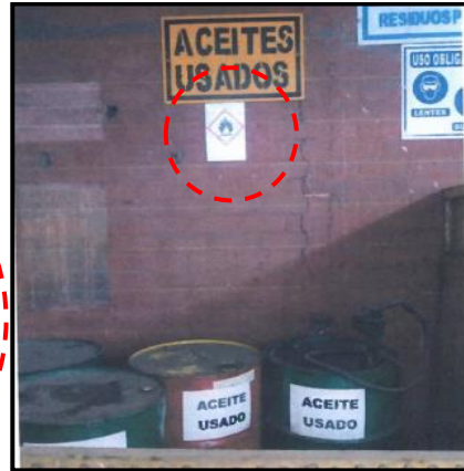
Fotografía N° 02: El Almacén se encuentra señalizado donde indica la peligrosidad del residuo.