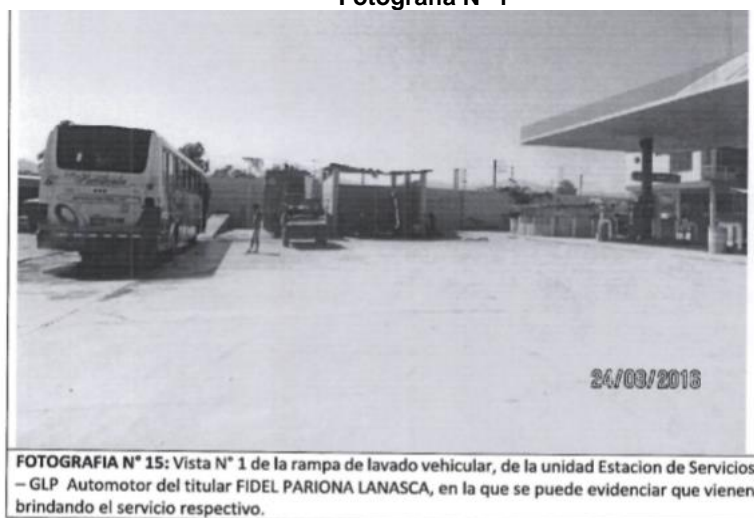
Fotografía N° 1