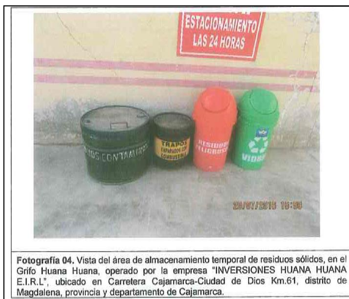
Fotografía 04. Vista del área de almacenamiento temporal de residuos sólidos, en el Grifo Huana Huana, operado por la empresa "INVERSIONES HUANA HUANA E.I.R.L.", ubicado en Carretera Cajamarca-Ciudad de Dios Km.61, distrito de Magdalena, provincia y departamento de Cajamarca.