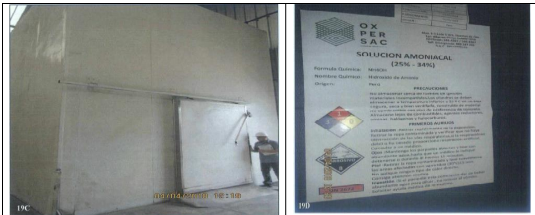
Fotografías N° 19 C y D: Vista de la primera área ampliada por el administrado, se aprecia un almacén refrigerado donde se almacena solución amoniacal en bidones.