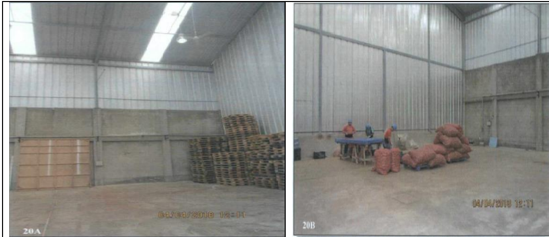
Fotografías N° 20 A y E: Vista de la segunda área ampliada por el administrado, se aprecia también presencia de personal de PRONEX realizando actividades de maquila para la empresa AGRO TUNA.