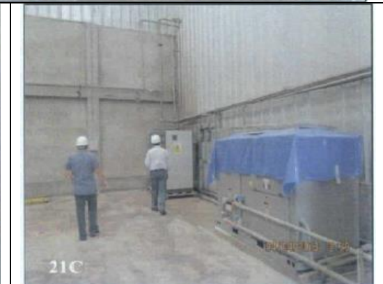
Fotografías N° 21 A, B y C: Vista de la tercera área ampliada por el administrado, se aprecia la instalación de un afila de racks almacenando cochinilla en sacos; en el lado opuesto al rack se observa una sub estación eléctrica y reactores en ensamblaje sin funcionamiento.