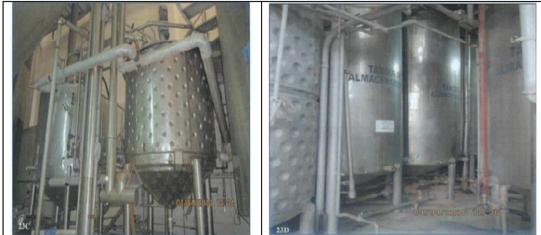
Fotografías N° 23 A y B: Vistas de la quinta área ampliada por el administrado, se aprecia equipos sin funcionamiento como: Atomizadores, entre otros, los cuales serán usados para una segunda línea para el proceso de achiote, según lo informó el administrado. Fotografías N° 23 C y D: Vistas de la quinta área ampliada por el administrado, también se aprecian equipos sin funcionamiento como reactores y tanques de almacenamiento los cuales serán usados para una segunda línea para el proceso de achiote.