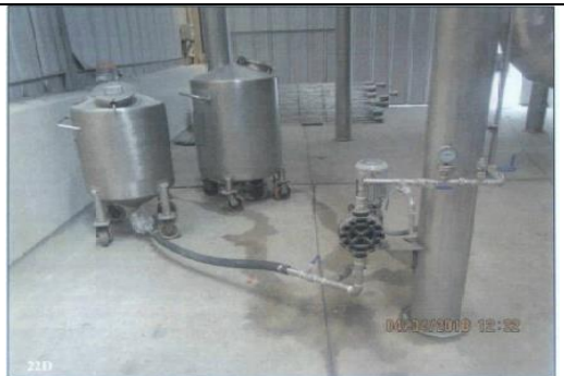
Fotografías N° 22 C y D: Vistas de la instalación de filtros mangas, líneas de acero inoxidable, entre otros, pertenecientes a la cuarta área ampliada.