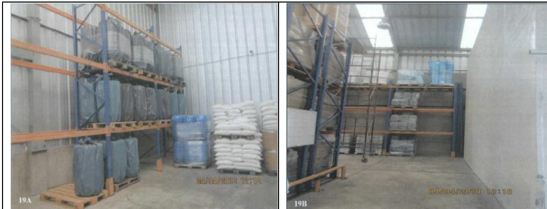
Fotografías N° 19 A y B: Vista de la primera área ampliada por el administrado, se aprecia racks instalados, en los cuales viene almacenando insumos y materiales.