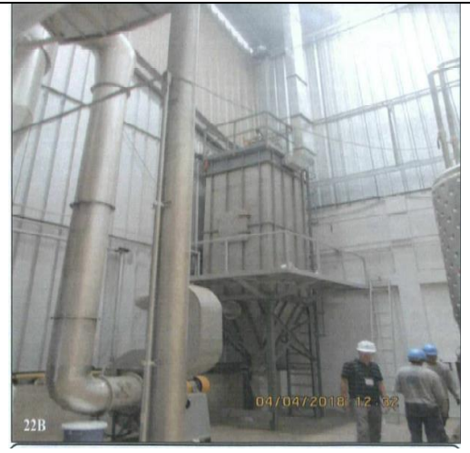
Fotografías N° 22 A y B: Vista de la cuarta área ampliada por el administrado, se aprecia a personal de empresas contratistas realizando actividades de ensamble e instalación de tanque y secador por atomizado.