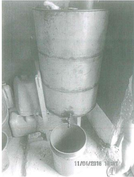
Fotografía N° 1