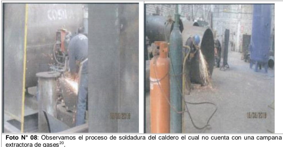
Foto N° 08: Observamos el proceso de soldadura del caldero el cual no cuenta con una campana extractora de gases 20 .