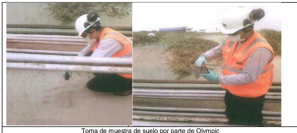
Toma de muestra de suelo por parte de Olympic