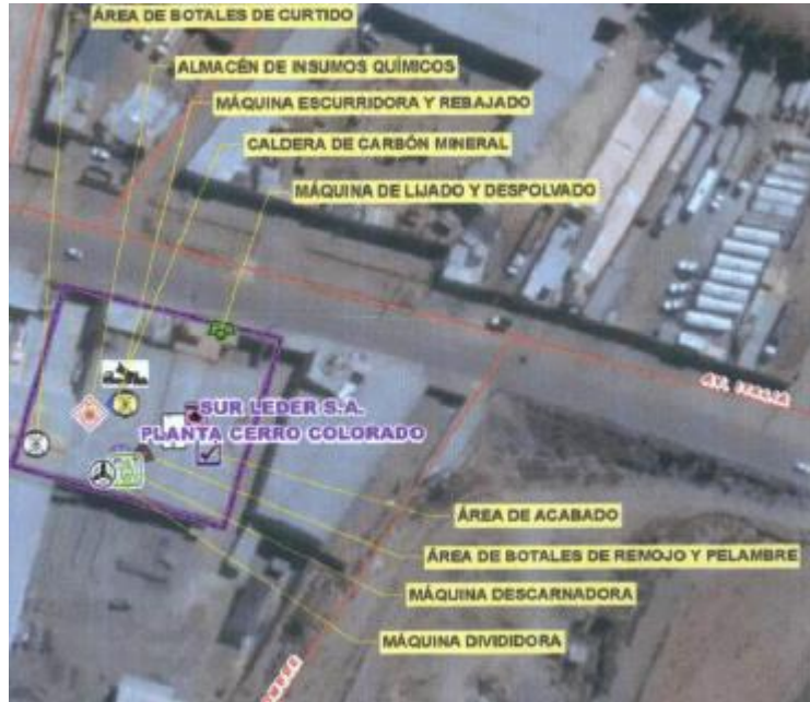
Fuente: Escrito con Registro N° 091282 del 18 de diciembre del 2017.

Decenio de la Igualdad de Oportunidades para Mujeres y Hombres Año de la Lucha contra la Corrupción y la Impunidad