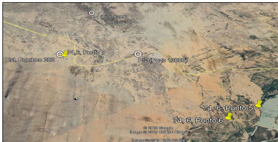
Gráfico N° 1: Mapa de ubicación de los puntos de muestreo realizado por la Dirección de Supervisión

Decenio de la Igualdad de Oportunidades para Mujeres y Hombres Año de la Lucha contra la Corrupción y la impunidad