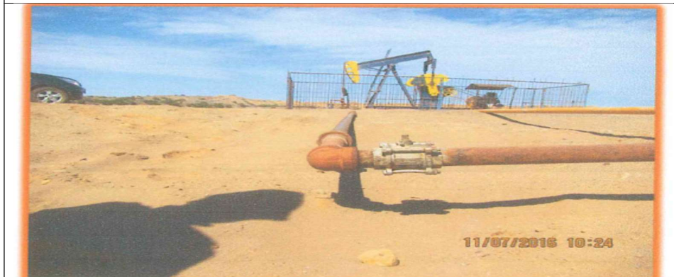
Fotografía N° 8: Pozo 13008 de la Batería 202.