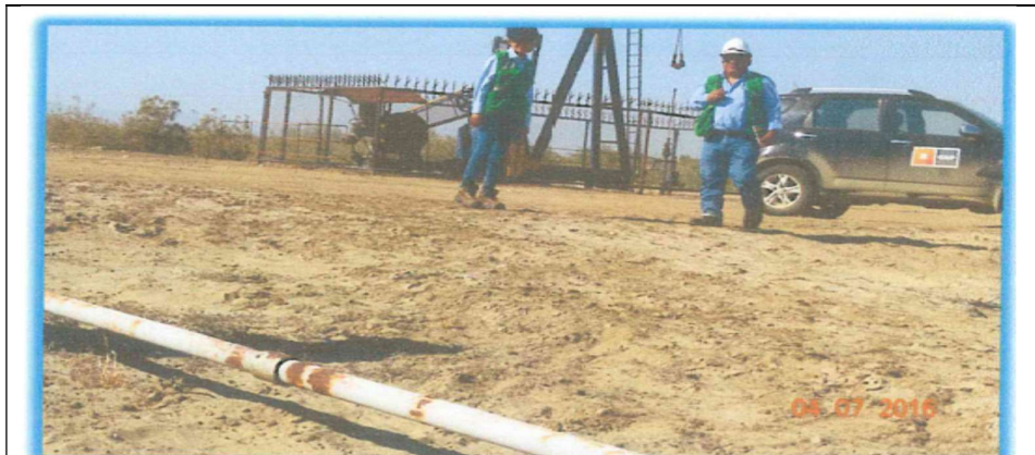
Fotografía N° 7: Pozo 6388 de la Batería 206.