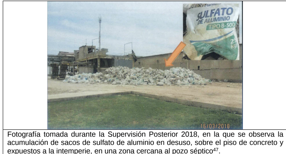
Fotografía tomada durante la Supervisión Posterior 2018, en la que se observa la acumulación de sacos de sulfato de aluminio en desuso, sobre el piso de concreto y expuestos a la intemperie, en una zona cercana al pozo séptico 47 .