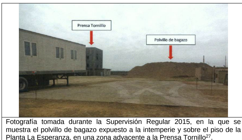
Fotografía tomada durante la Supervisión Regular 2015, en la que se muestra el polvillo de bagazo expuesto a la intemperie y sobre el piso de la Planta La Esperanza, en una zona adyacente a la Prensa Tornillo 27 .

25. De conformidad con lo consignado en el Acta de Supervisión 25 , durante la Supervisión Regular 2015, la Dirección de Supervisión observó que el polvillo del bagazo, generado en la Prensa Tornillo, se encontraba apilado sobre el piso de la Planta La Esperanza y expuesto a la intemperie, conforme se muestra en la siguiente fotografía 26 :