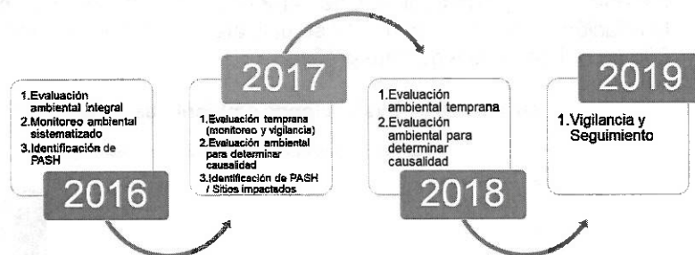
Gráfico N° 2: Actividades de evaluación ambiental formuladas en Planefa y POI, 2016 - 2019

Fuente: Planefa del OEFA 2016, 2017, 2018 y 2019 ( https://www.oefa.gob.pe/planefa ) y POI del OEFA 2016, 2017 y 2018 ( https://www.oefa.gob.pe/resultados-de-busqueda?node=151 ) Elaboración: propia