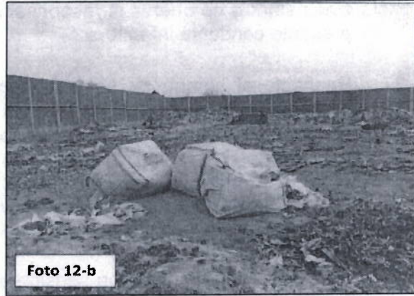
FOTO N° 12: Establecimiento propio del administrado, ubicado en Calle Los Eucaliptos Mz P s/n Sector Los Claveles Centro Poblado El Milagro, distrito de la Esperanza (E.713429 N: 9109502), se observó que cuenta con un área de 4700 m 2 aproximadamente, el cual se encuentra cercado con material noble y portón metálico sobre terreno afirmado a la intemperie, observándose la disposición final de los lodos generados en su sistema de tratamiento de efluentes industriales. (Foto 12 a y b)