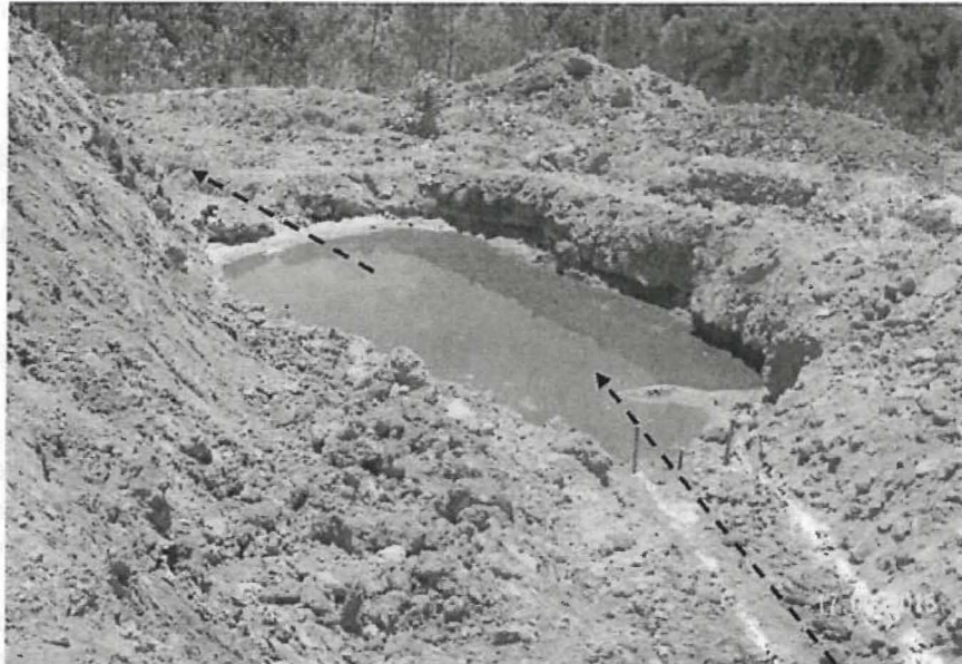
Fotografía N° 80: Hallazgo N° 01: En el depósito de relaves Higospampa se han instalado disipadores para la captación de agua desde el interior del depósito de relave, los que son canalizados hacia pozas excavadas en tierra. Ubicada en las coordenadas UTM WGS84 N-9160384, E-777162.

60. A su vez, en el Informe de Supervisión 2015, la DS señaló lo siguiente: