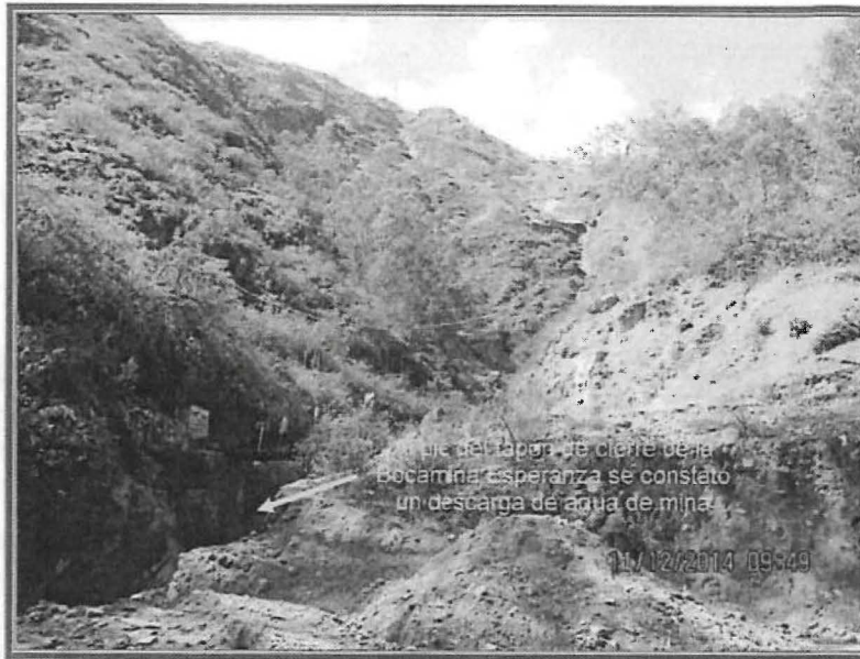
Fotografía N° 23: Bocamina La Esperanza. Vista panorámica de la bocamina Esperanza, en el nivel 2382. Al pie del tapón de cierre se constató un afloramiento de agua hacia la quebrada.