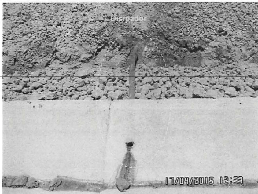
Fotografía N° 79: Hallazgo N° 01: En el depósito de relaves Higospampa se han instalado disipadores para la captación de agua desde el interior del depósito de relave, estos desembocan en cunetas con un pH de 1,2 (cuneta de la margen izquierda) y 1,13 (cuneta de la margen derecha). Ubicada en las coordenadas UTM WGS84 N-9160384, E-777162.