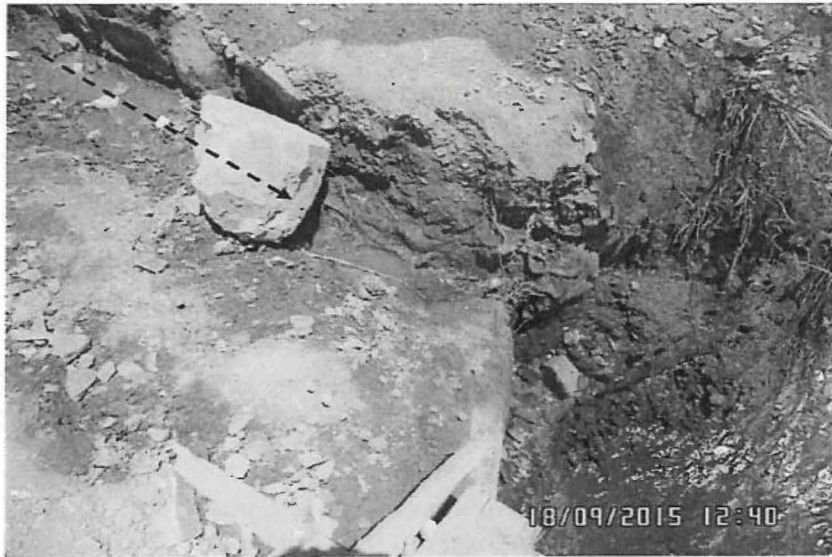
Fotografía N° 91: Hallazgo N° 05: Otra vista de la bocamina Esperanza donde se evidenció filtraciones de agua en el techo, paredes, piso y alrededores de la bocamina generando un flujo mínimo de agua, que discurre hasta la quebrada Esperanza. Ubicada en las coordenadas UTM WGS84 N-9159527, E-779177.