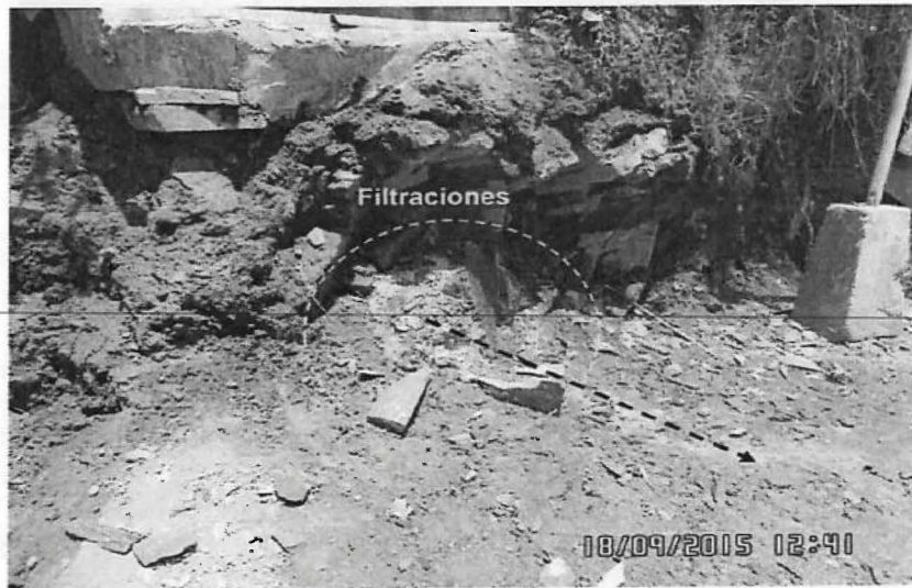
Fotografía N° 92: Hallazgo N° 05: Vista de la bocamina Esperanza donde se evidenció filtraciones de agua en el techo, paredes, piso y alrededores de la bocamina generando un flujo mínimo de agua, que discurre hasta la quebrada Esperanza. Ubicada en las coordenadas UTM WGS84 N-9159527, E-779177.