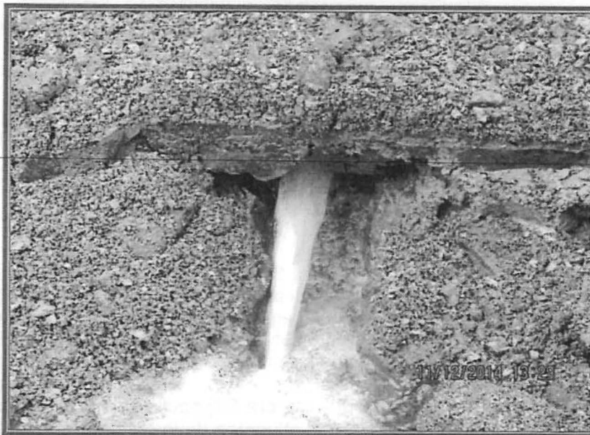
Fotografía N° 26: Bocamina Esperanza. En la quebrada Esperanza, al pie del tapón hermético de la bocamina Esperanza, se detectó un chorro de agua, que podría provenir del interior de la bocamina cerrada.