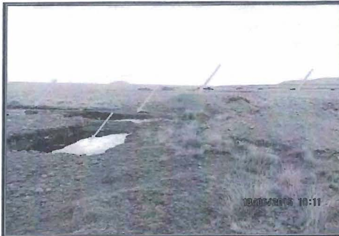
Fotografía N° 17: La fotografía muestra las pozas construidas en la plataforma de perforación 173, así como la acumulación de material de corte procedente de la construcción de las mismas.