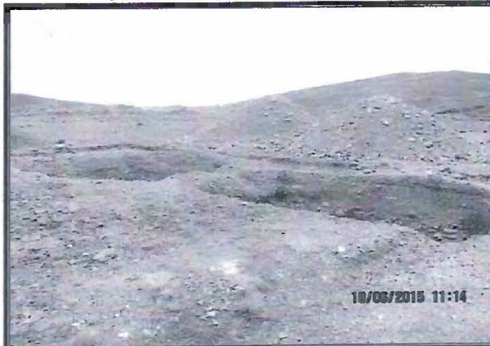
Fotografía N° 50: La fotografía muestra las pozas de sedimentación y el material de corte extraído en la plataforma 13.