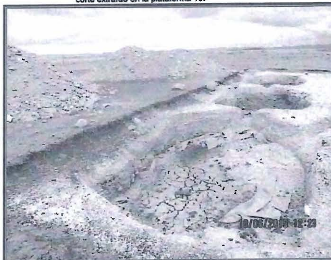
Fotografía N° 97: La fotografía muestra las dimensiones de las pozas de sedimentación y el material de corte extraído en la plataforma 16.