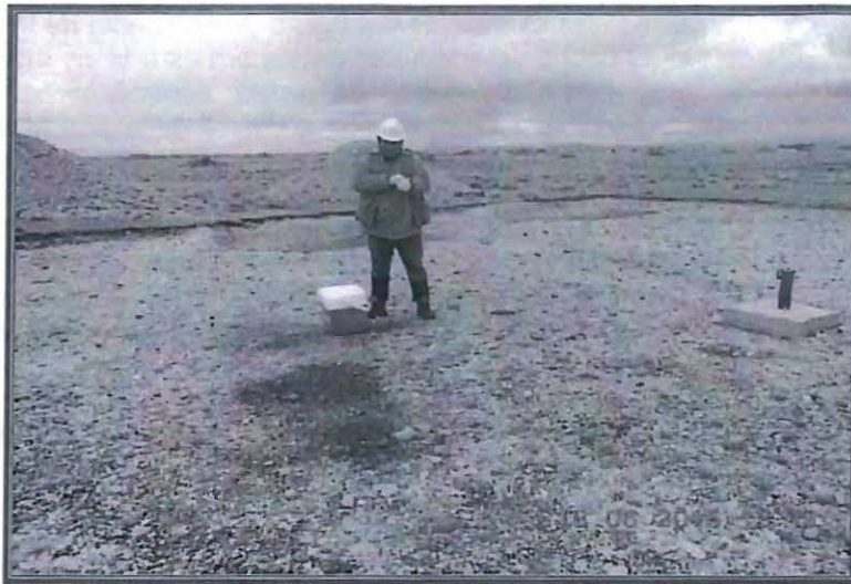
Fotografía N° 163: Vista fotográfica del punto de muestreo 326,6,ESP-1, ubicado dentro del área de la Plataforma de Perforación N° 163.