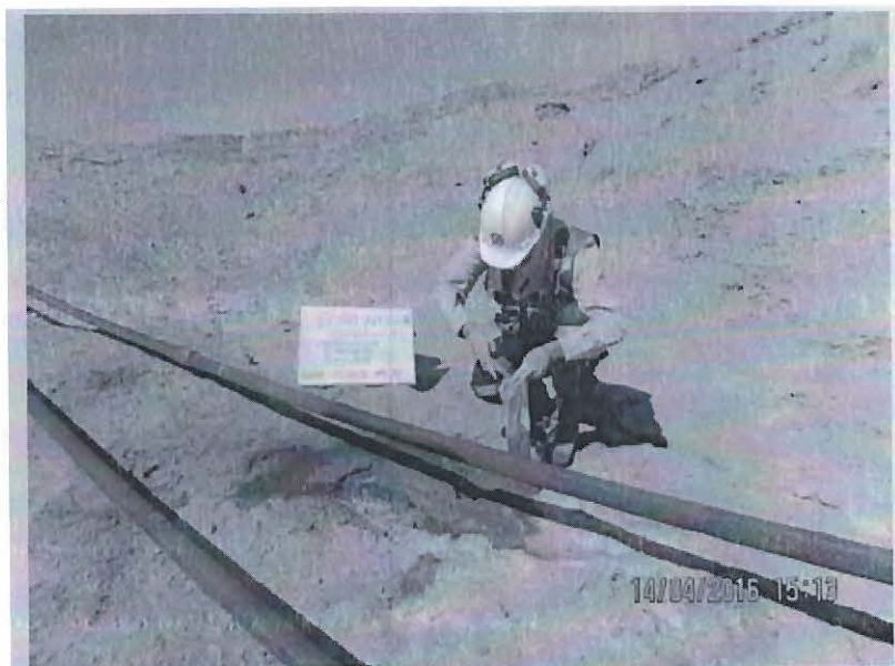
FOTO N° 72: Pozo 11041 - BAT PN-32: Se observó suelo impregnado con fluido de producción debajo de la línea de producción de 2 pulgadas de diámetro del pozo 11041 de la Batería PN-32, a 35 metros en dirección norte del cabezal del pozo, con medidas de 1,00 m x 0,50 m y 30 cm de profundidad. Coordenadas UTM (WGS84), Zona 17: 9527518N, 0472691E.