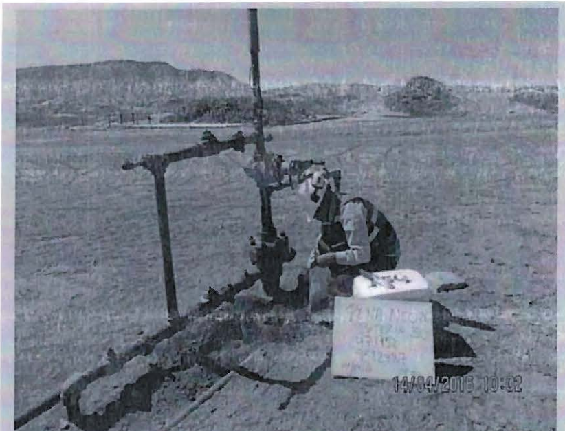
FOTO N° 71: Pozo 5668 - BAT PN-30: Se observó suelo impregnado con hidrocarburo junto al cabezal del pozo 5668 de la Batería PN-30, con medidas de 1,00 m x 0,50 m y 15 cm de profundidad. Coordenadas UTM (WGS84), Zona 17: 9522487N, 0471952E.