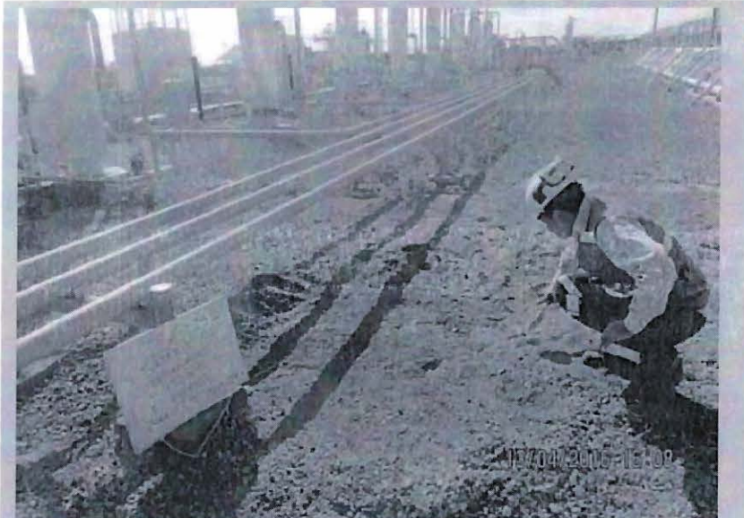
FOTO N° 70: Batería ZA-01: Se observó suelo impregnado con hidrocarburo entre el manifold de pozos y el separador de prueba SP-8 de la Batería ZA-01, a una distancia de 4 metros del separador de prueba SP-8, con medidas de 1,50 m x 1,30 m y 5 cm de profundidad. Coordenadas UTM (WGS84), Zona 17: 9528196N, 0484168E.