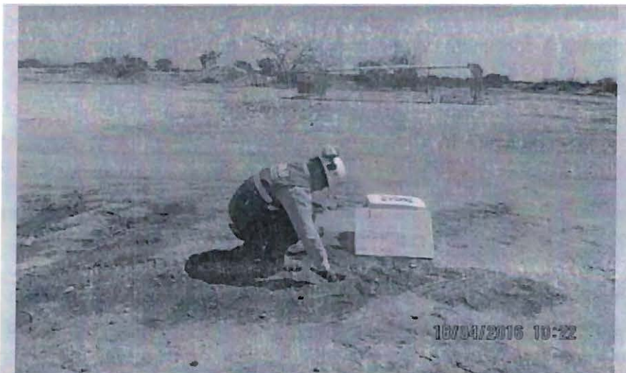
FOTO N° 74: Pozo 9963 - BAT ZA-02: Se observó suelo impregnado con hidrocarburo a 35 metros en dirección sur del cabezal del pozo 9963 de Batería ZA-02, con medidas de 3,00 m x 4,00 m y 5 cm de profundidad. Coordenadas UTM (WGS84), Zona 17: 9526861N, 0486648E.