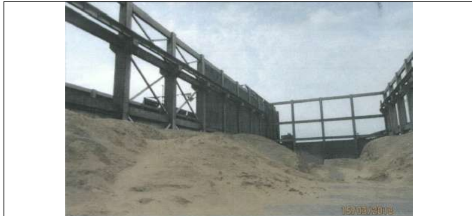
Fotografía tomada durante la Supervisión Posterior 2018, en la que se muestra el polvillo de bagazo generado en la Planta La Esperanza, almacenado en un área delimitada 35 .