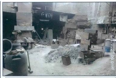
Foto N° 7: Se observa el área donde se desprende mecánicamente los moldes, para la separación de la pieza metálica de la mezcla del molde (arena sílice, resina, bentonita y tierra para fundición).