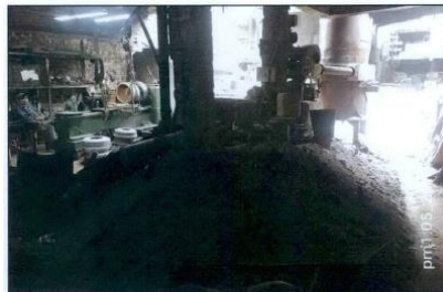
Foto N° 9: En el punto de acopio central de residuos, se observó material de la mezcla desprendida de las actividades del desmoldeo, sobre suelo directo.