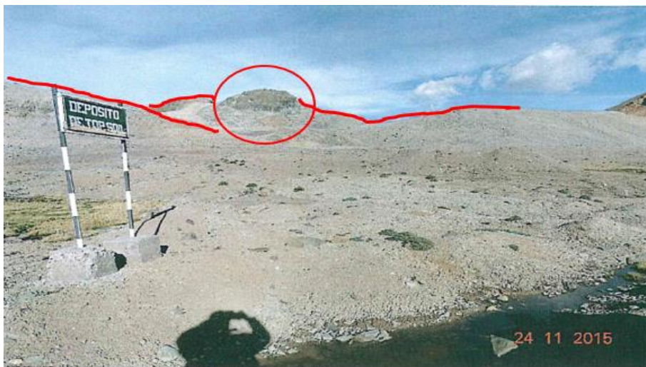
FOTO N° 5 HALLAZGO DE GABINETE Vista de la cancha de Top Soil. Coordenadas (Datum GWS84) N 8385322, E 772029.