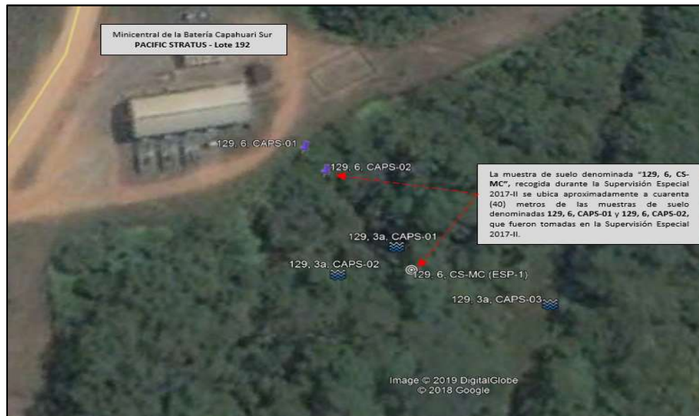
Imagen Satelital de los Puntos de Monitoreo tomados durante la Supervisión Especial 2017 I y 2017 II

Elaborado por: Dirección de Fiscalización y Aplicación de Incentivos.