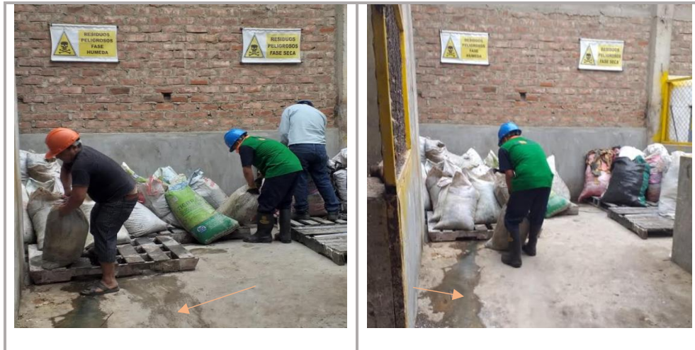
Fuente: Documento presentado mediante escrito N° 102922 el 26 de diciembre del 2018.