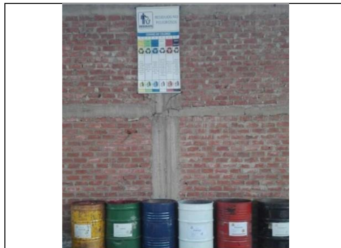
Fotografía del descargo: Se observa cilindros metálicos acondicionado de acuerdo al código de colores e implementados en un área para el acopio temporal de los residuos.