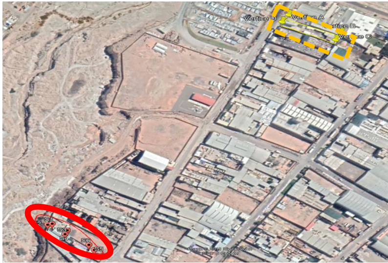
Elaboración Dirección de Fiscalización y Aplicación de Incentivos