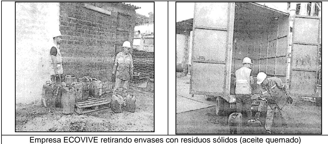
Empresa ECOVIVE retirando envases con residuos sólidos (aceite quemado)