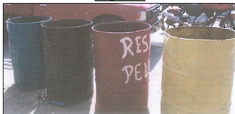
Fotografía N° 4