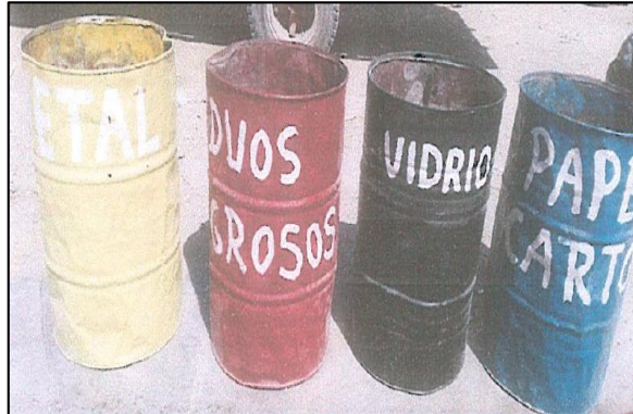
Fotografía N° 2