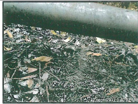
Foto N° 5: Momento cuando ocurrió fuga en el Joint 22 de la línea de flujo de 6” del pozo Shivyacu 24 – evento ocurrido el 17 de septiembre.