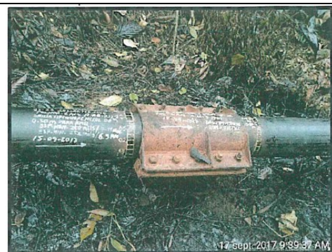
Foto N° 2: Fisura 1 del Joint 22 de la línea de flujo de 6" del pozo Shivyacu 24 – evento ocurrido el 14 de setiembre.