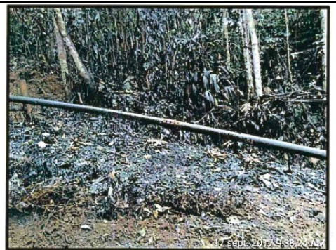
Foto N° 8: Suelo y vegetación impregnado con hidrocarburo en el Joint 22 de la línea de flujo de 6” del pozo Shivyacu 24.