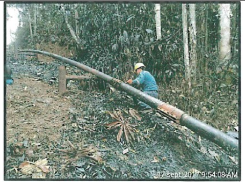
Foto N° 6: Instalación de tercera grapa en el Joint 22 de la línea de flujo de 6” del pozo Shivyacu 24 – evento ocurrido el 17 de septiembre.