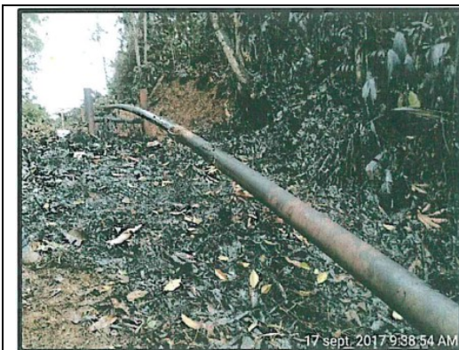
Foto N° 3: Fisura 2 del Joint 22 de la línea de flujo de 6" del pozo Shivyacu 24 – evento ocurrido el 14 de setiembre.