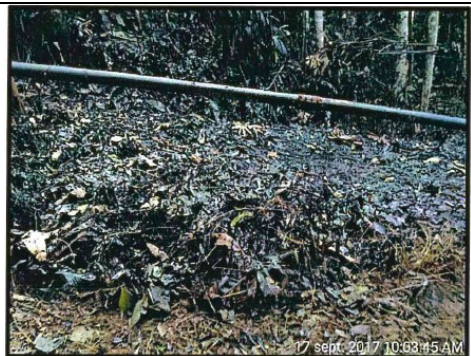
Foto N° 7: Suelo y vegetación impregnada con hidrocarburo en el Joint 22 de la línea de flujo de 6” del pozo Shivyacu 24.