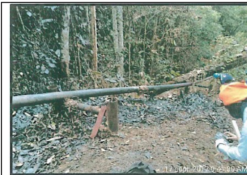
Foto N° 1: Fisura 1 del Joint 22 de la línea de flujo de 6" del pozo Shivyacu 24 – evento ocurrido el 14 de setiembre.