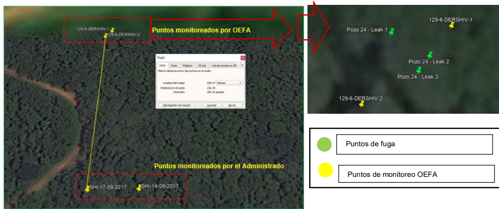
Fuente: Acta de Supervisión, Informes de Ensayo N° 23994/2018, N° 23997/2018 y N° SAA-17/02280 Elaboración: Dirección de Fiscalización y Aplicación de Incentivos del OEFA.