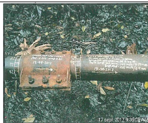
Foto N° 4: Fisura 2 del Joint 22 de la línea de flujo de 6" del pozo Shivyacu 24 – evento ocurrido el 14 de setiembre.