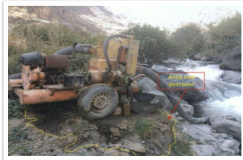
Fotografía N° 1 Se observa el derrame de hidrocarburo y la motobomba en la orilla del río Chancay