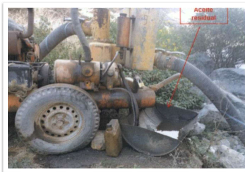
Fotografía N° 2 Se observa la bandeja con aceite residual y la motobomba a la orilla del río Chancay