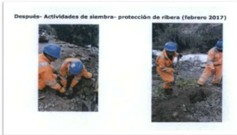
Fotografías, de febrero de 2017 se observa a personas realizando el sembrado de plantas