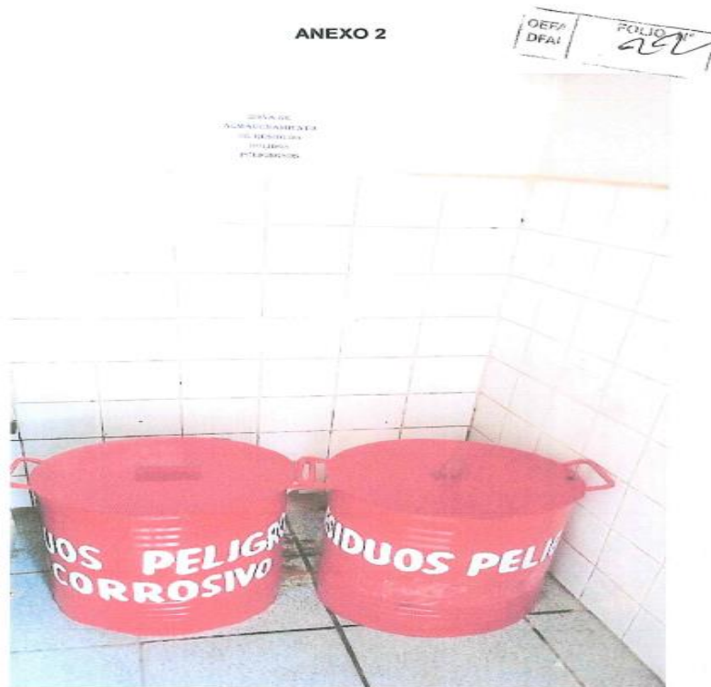
Imagen N° 2