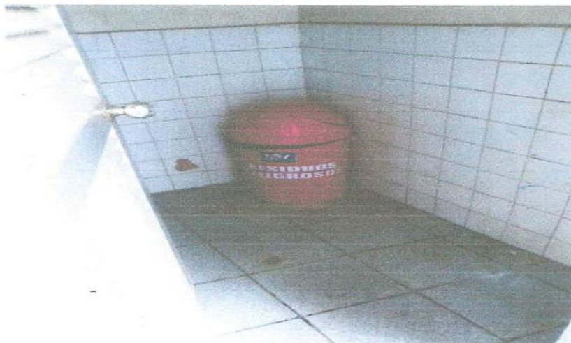
Imagen N° 1