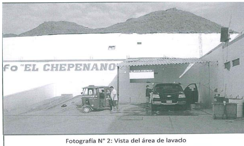
Fotografía N° 2: Vista del área de lavado