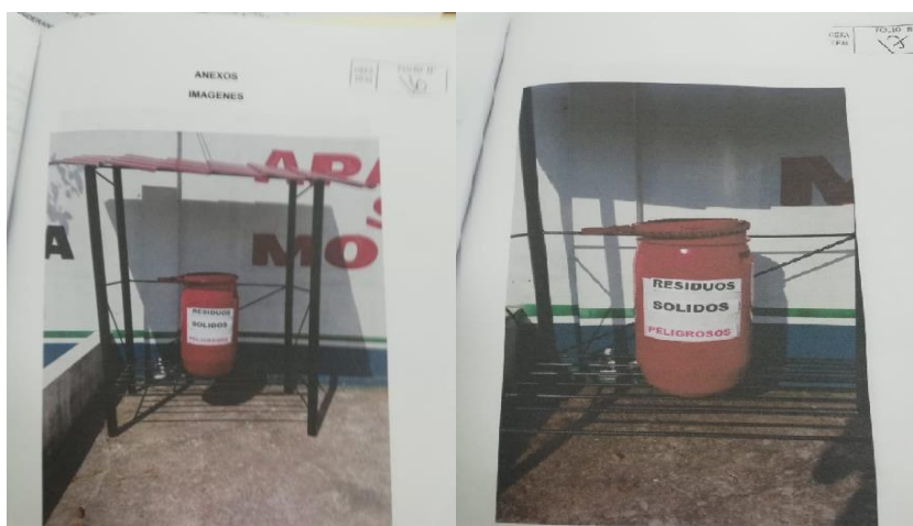
Imagen N° 4