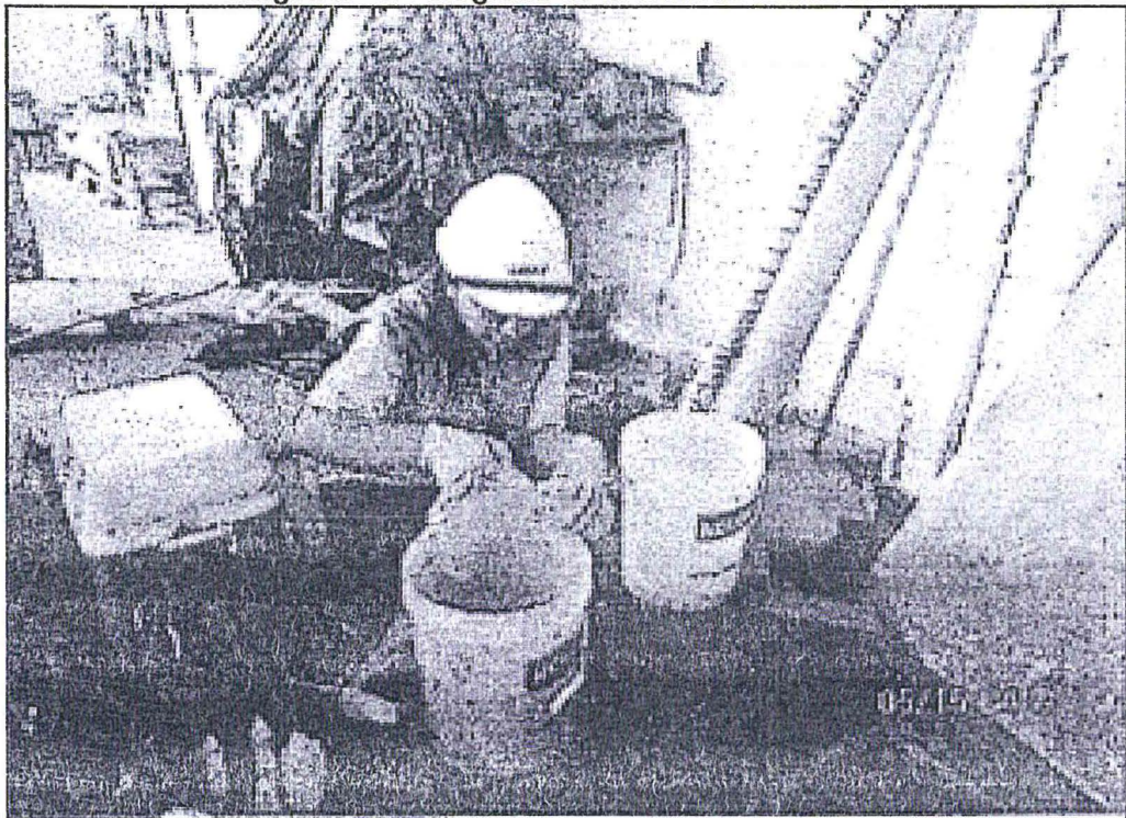
Imagen N° 1: Fotografía de la toma de la muestra

Fuente: Panel Fotográfico de la Supervisión Regular 2015 38