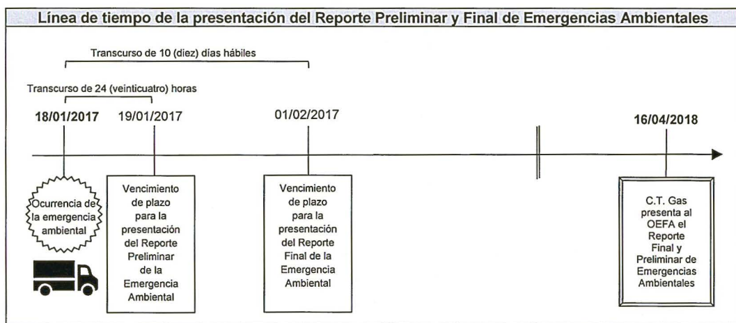
Cuadro N° 1

Elaboración: Dirección de Fiscalización y Aplicación de Incentivos.