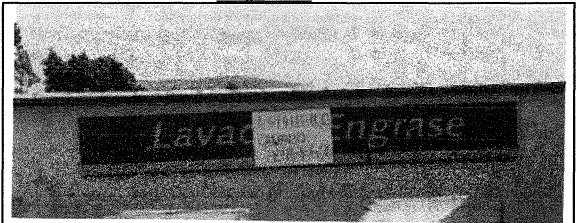
LETRERO " PROHIBIDO LAVADO Y ENGRASE DE VEHICULOS"