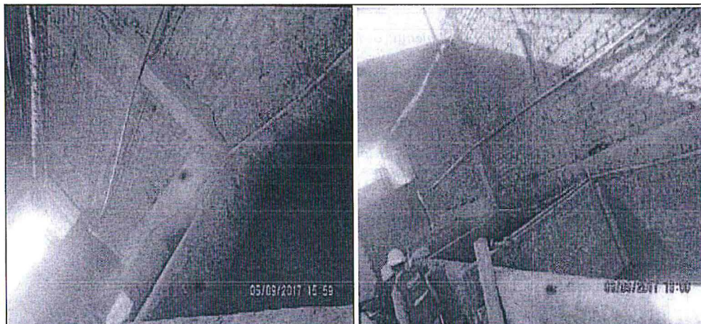
Fotografías tomadas durante la supervisión Regular 2017, en las que se muestran las pozas utilizadas para el proceso de encalado para el remojo de las pieles en la Planta La Esperanza.