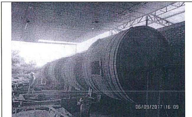
Fotografía tomada durante la supervisión Regular 2017, en la que se muestra los cuatro botaes utilizados en el proceso de curtido y recurtido de la Planta La Esperanza.

Supervisión Regular 2017, se observó que el administrado cuenta con cuatro (4) botaes para los procesos de curtido y recurtido y cuatro (4) pozas para el proceso de encalado, entre otros equipos y maquinarias, conforme se muestra en las siguientes fotografías 14 :