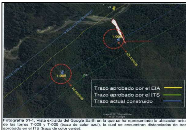
Vista Fotográfica N° 01-1 del Informe de Supervisión N° 1

25. Lo detectado por la Dirección de Supervisión se sustenta adicionalmente en la vista fotográfica N° 01-1 del Informe de Supervisión N° 1 y la vista fotográfica N° 04 del Informe de Supervisión N° 2, conforme se detalla a continuación: