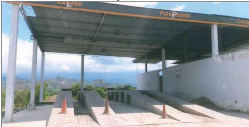
Fotografía N° 2: