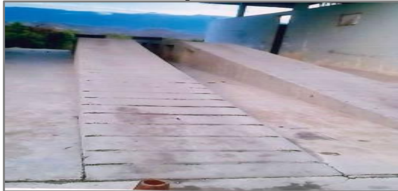
Fotografía N° 1: