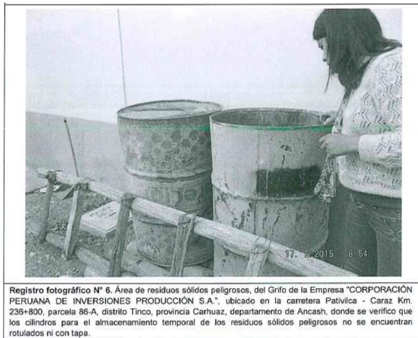
Imagen N° 1: