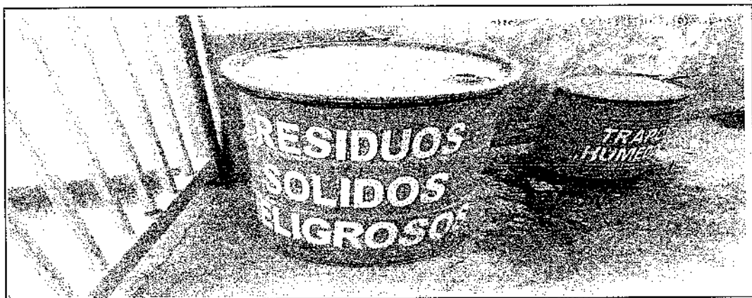
Registros fotográfico N° 1 al 4