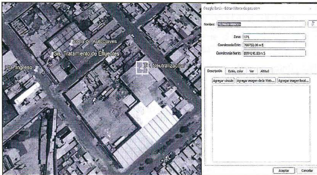
Figura N° 1