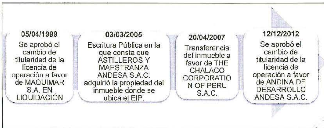
Elaboración: Dirección de Fiscalización y Aplicación de Incentivos del OEFA.