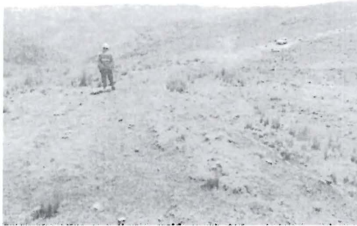
Imagen del acceso ubicado en las coordenadas WGS 84: N 8 436 062 E 186 752