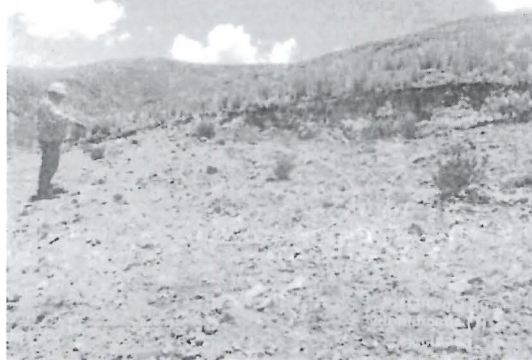
Imagen del acceso ubicado en las coordenadas WGS 84: N 8 435 937 E 186 611