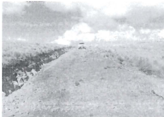
Imagen del acceso ubicado en las coordenadas WGS 84: N 8 436 067 E 186 496

Handwritten blue ink scribbles and lines on the left margin of the page.