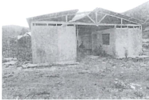
Imagen de la plataforma ubicada en las coordenadas WGS 84: N 8 436 281 E 186 734