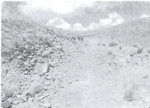
Imagen del acceso ubicado en las coordenadas WGS 84: N 8 436 135 E 186 688