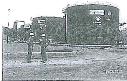
Foto N° 53. Jibarito -Vista desde otro ángulo, nótese el área estanca de los tanques indicados líneas arriba, no tiene dique de contención en un tramo.

Vista interna del muro de contención reparado y conformación de rampa de acceso al patio de tanques Jibarito. 0386050E / 9695978N (08 de noviembre de 2012)