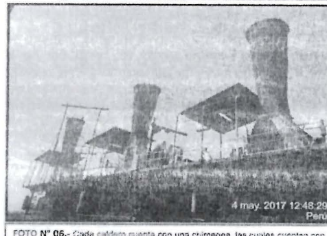
FOTO N° 05.- Cofre caldero cuenta con una chimenea, las cuales cuentan con una altura aproximada de 18 m, a excepción de la chimenea 01 que cuenta con una altura de 20 m. Así también, durante el recorrido no se advirtió que las chimeneas de los calderos cuentan con un puerto de muestreo para la realización de monitoreo de emisiones.