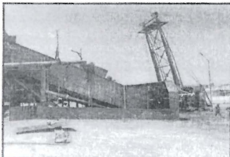
FOTO N° 01.- Área de recepción de caña, conformada básicamente por la masa cañera y la grúa hilo, los cuales ayudan en la descarga de la caña cosechada de los campos de cultivo.