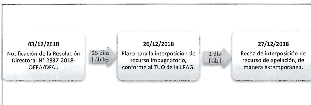
Gráfico N° 1: Plazo para la interposición del recurso de apelación