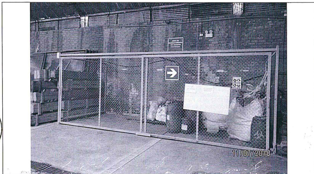
Fotografía 21. Vista del área de almacenamiento de residuos peligrosos, se encuentra cercado con malla metálica y piso pulido de concreto revestido con geo membrana, los residuos se encuentran segregados e identificados mediante rótulos en la pared, posee sistema de canaletas para contener los lixiviados.