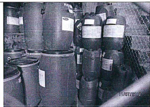
Fotografía 29. Envases de insumos químicos, durante la supervisión se verificó que se encuentran vacíos, colocados sobre piso de concreto pulido y recubierto con geomembrana.