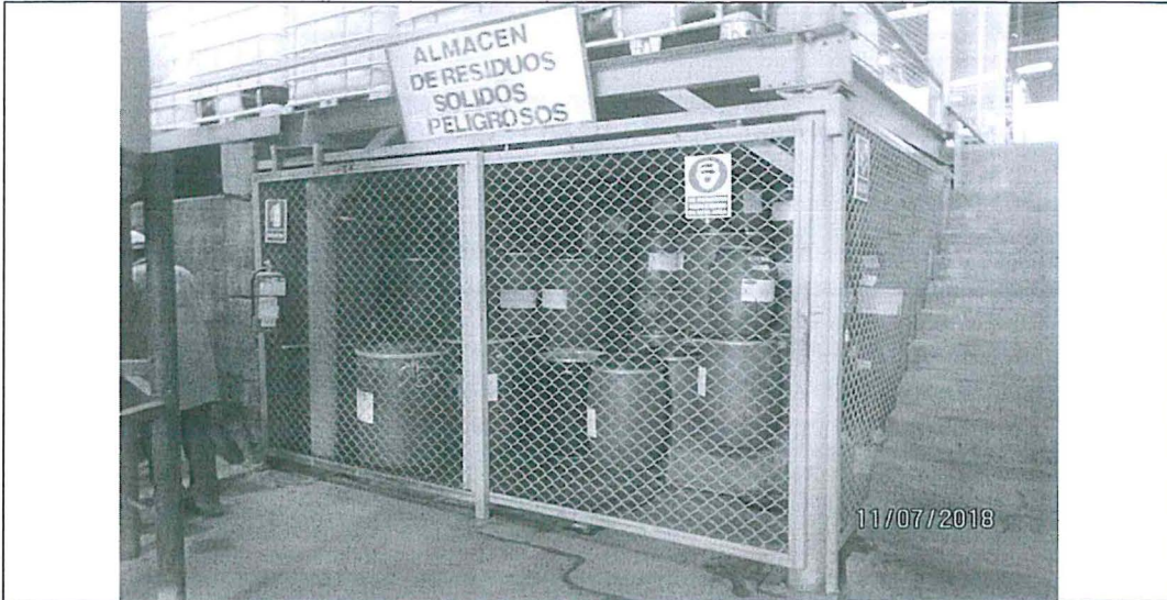
Fotografía 28. Almacén de residuos sólidos peligrosos (envases de insumos químicos en desuso).

41. Asimismo, lo verificado por la Autoridad Supervisora, se dejó constancia en la Ficha de Obligaciones Verificadas, conforme al siguiente detalle: