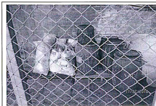
Fotografía 22. Los residuos dentro del almacén se encuentran segregados, se observan bolsas vacías de insumos químicos, lodos contenidos en recipientes plásticos y recortes de cuero en costales. Están colocados sobre parihuelas de madera y geomembrana. No se observaron residuos líquidos ni signos de derrame.