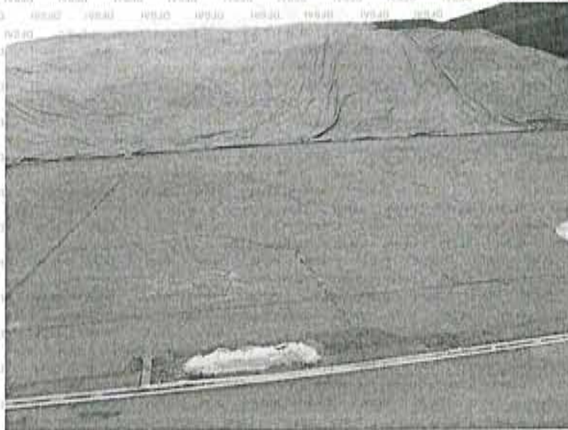
"Vista fotográfica N° 15: Fisuras en el piso que deben ser selladas con materiales que soporten el tránsito de camiones cargados." (folio 29)