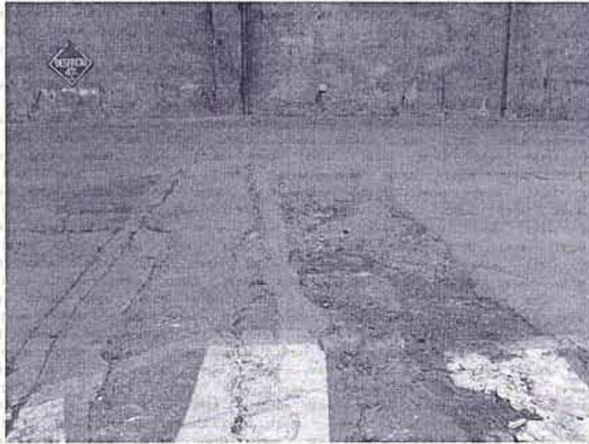
"Vista fotográfica N° 17: Fisuras en el piso que deben ser selladas con materiales que soporten el tránsito de camiones cargados." (folio 30)

10. Por lo expuesto, se aprecia que a la fecha de la fiscalización, existían rajaduras en el piso que eran propicias para almacenar finos de materiales.