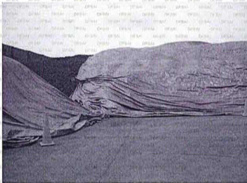
"Vista fotográfica N° 03: Observación N° 03. Se observa que las rumas de coque situadas dentro del depósito no estaban totalmente cubiertas con mantas." (folio 23)