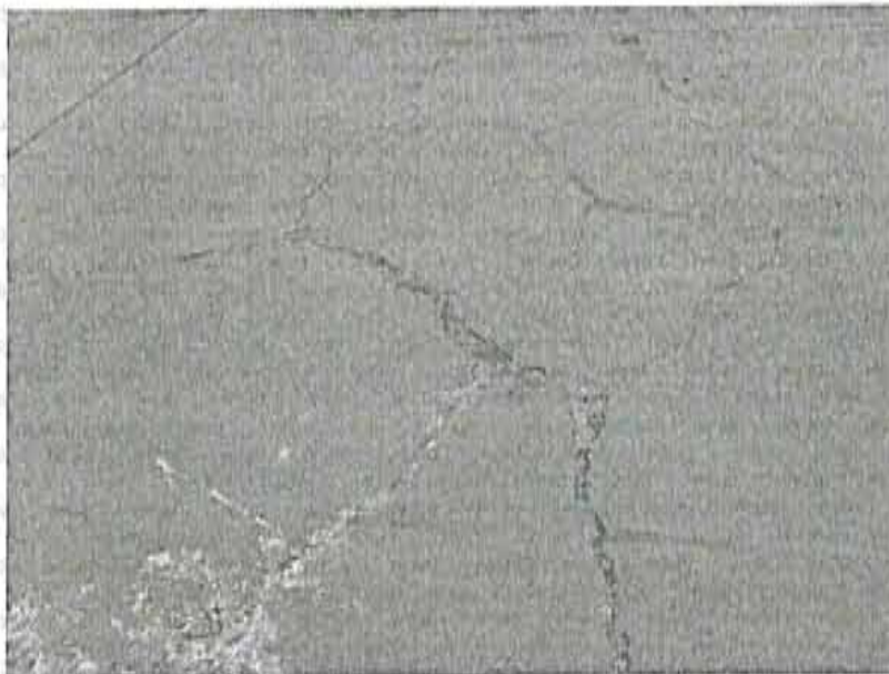
"Vista fotográfica N° 16: Fisuras en el piso que deben ser selladas con materiales que soporten el tránsito de camiones cargados." (folio 29)