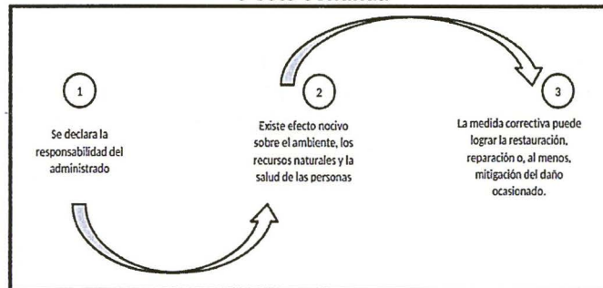
Elaboración: Dirección de Fiscalización y Aplicación de Incentivos del OEFA

48. De acuerdo al marco normativo antes referido, corresponderá a la Autoridad Decisora ordenar una medida correctiva en los casos en que la conducta infractora haya ocasionado un efecto nocivo en el ambiente, los recursos naturales y la salud de las personas, o dicho efecto continúe; habida cuenta que la medida correctiva en cuestión tiene como objeto revertir, reparar o mitigar tales efectos nocivos 24 . En caso contrario -inexistencia de efecto nocivo en el ambiente, los recursos naturales y la salud de las personas- la autoridad no se encontrará habilitada para ordenar una medida correctiva, pues no existiría nada que remediar o corregir.